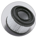
HEPA Kartuschenfilter (opt.)