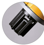
Korbfilterhalterung mit Schwimmer